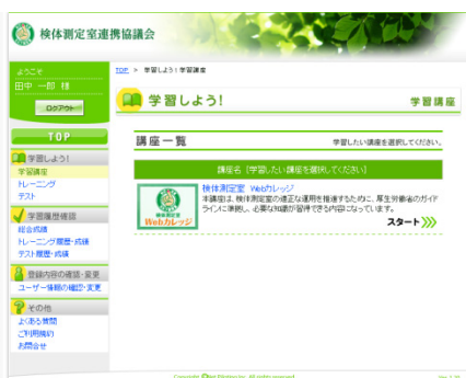
▲「検体測定室 Web カレッジ」画面イメージ

※『検体測定室に関するガイドライン』第2-17項（研修）に、「運営責任者は、業務に従事する者に、内部研修に留まることなく、関係法令、精度管理、衛生管理、個人情報保護等について必要な外部研修を受講させるものとする」と規定されている。